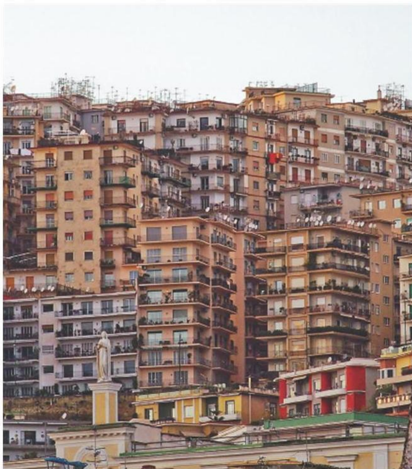
Quest'anno i prezzi delle case sono previsti in calo del 5%

Le occasioni, per chi vuole comprare oggi, non mancano. La differenza la fa la possibilità di avere di fronte a sé un venditore che deve vendere e che non può rinviare l'operazione. Sono in molti a trovarsi in questo tipo di situazione, raccontano gli operatori del settore. Ma questo tipo di vendi-